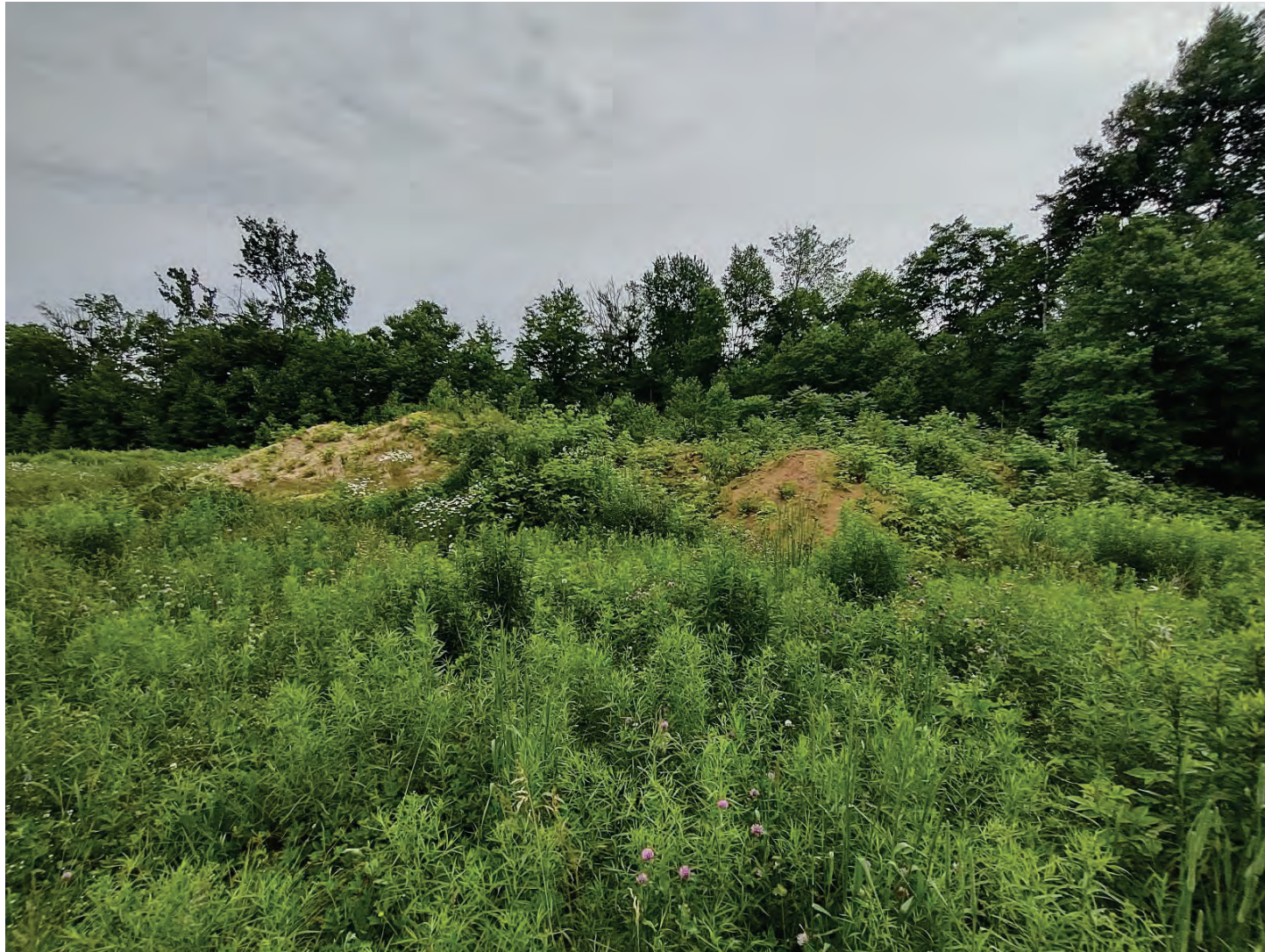
Photo 8. Amas de sol arable et/ou sol mélangé