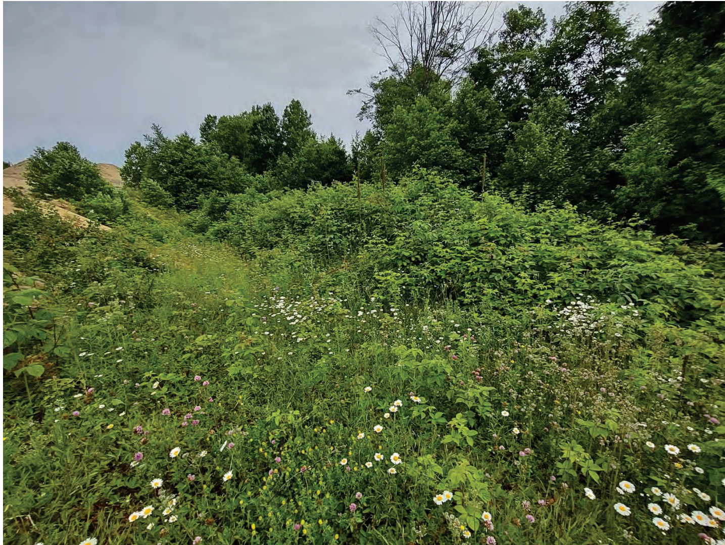
Photo 9. Amas de sol arable