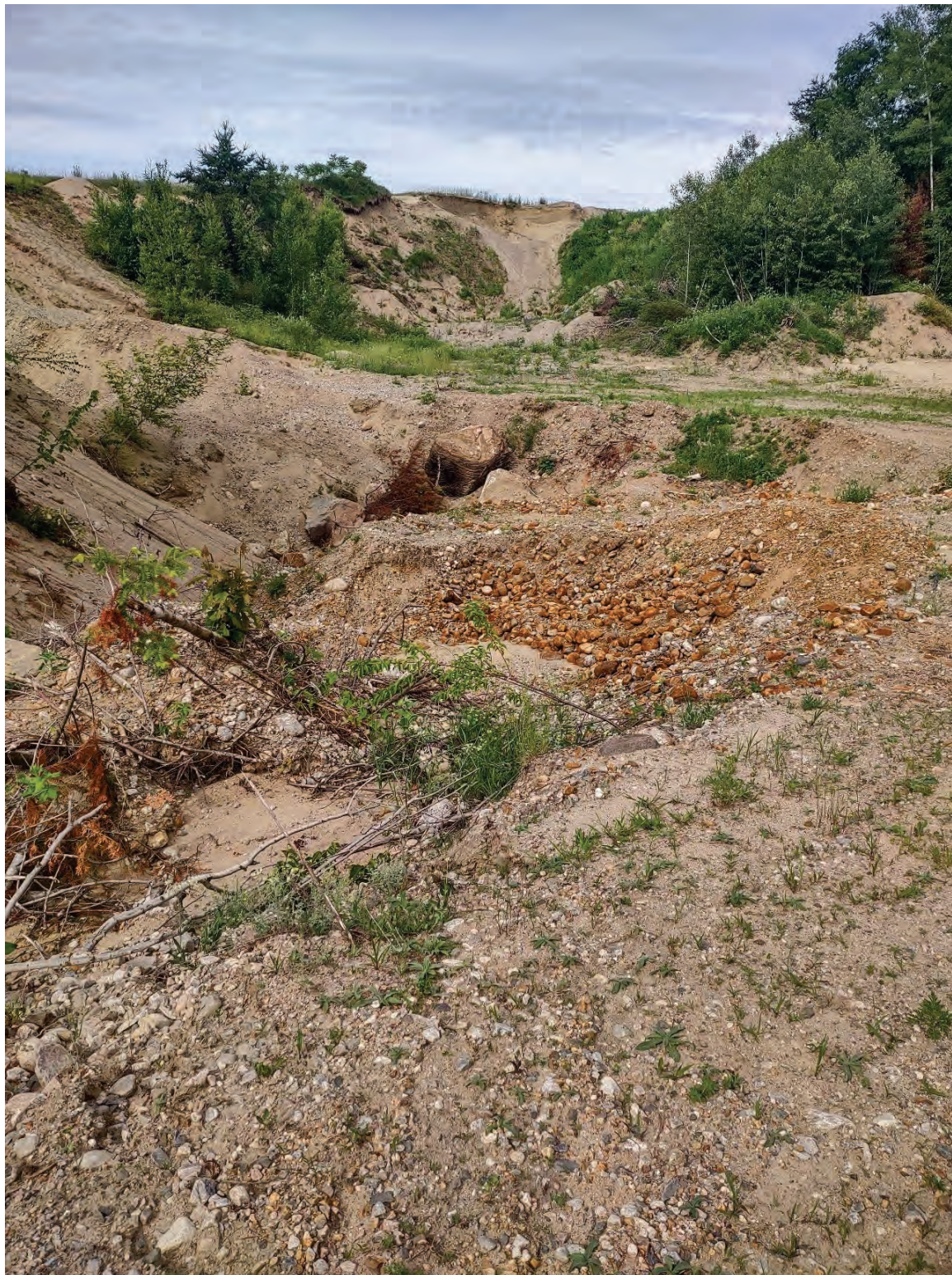
Photo 7. Plancher de l'ancienne exploitation et cavité sans signe de la nappe phréatique