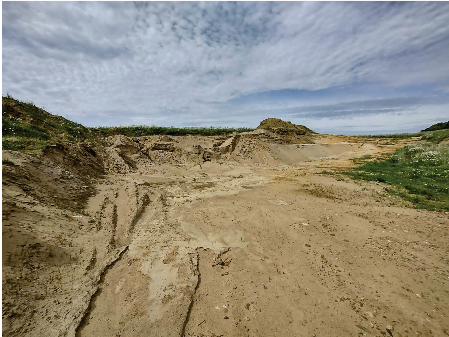
Photo 6. Secteur sud-est exploité en dehors de la superficie autorisée