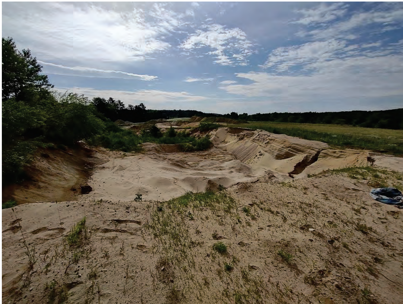
Photo 1. Secteur sud-ouest exploité en dehors de la superficie autorisée