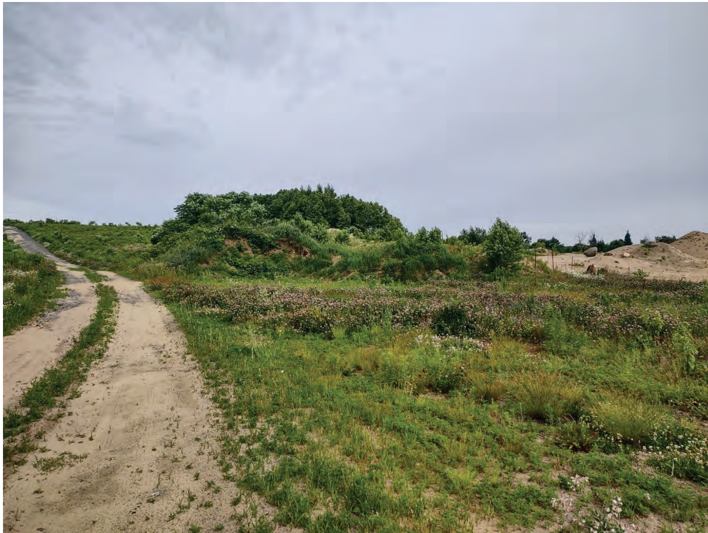
Photo 10. Amas de sol arable