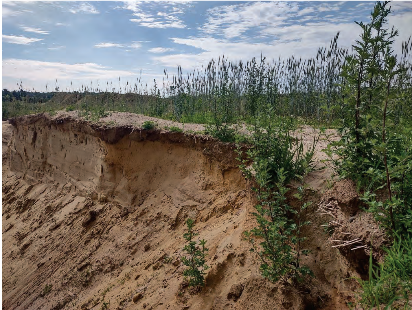
Photo 2. Environ 15 cm de sol arable dans la zone intacte