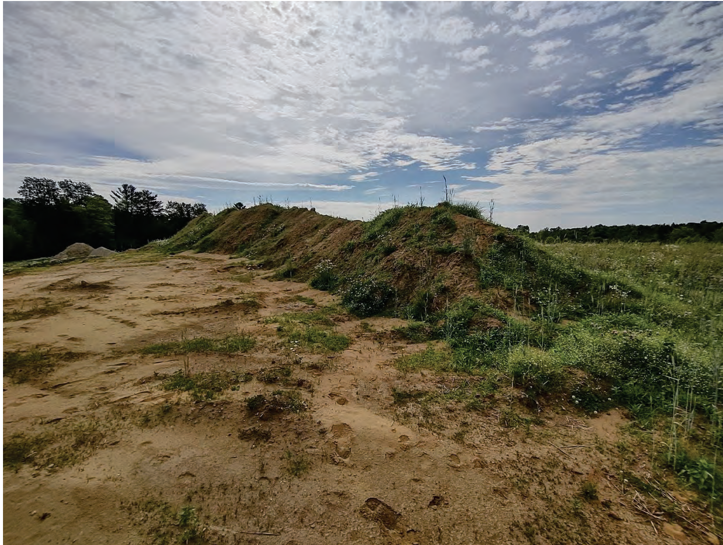
Photo 4. Amas de sol arable sans couverture végétale