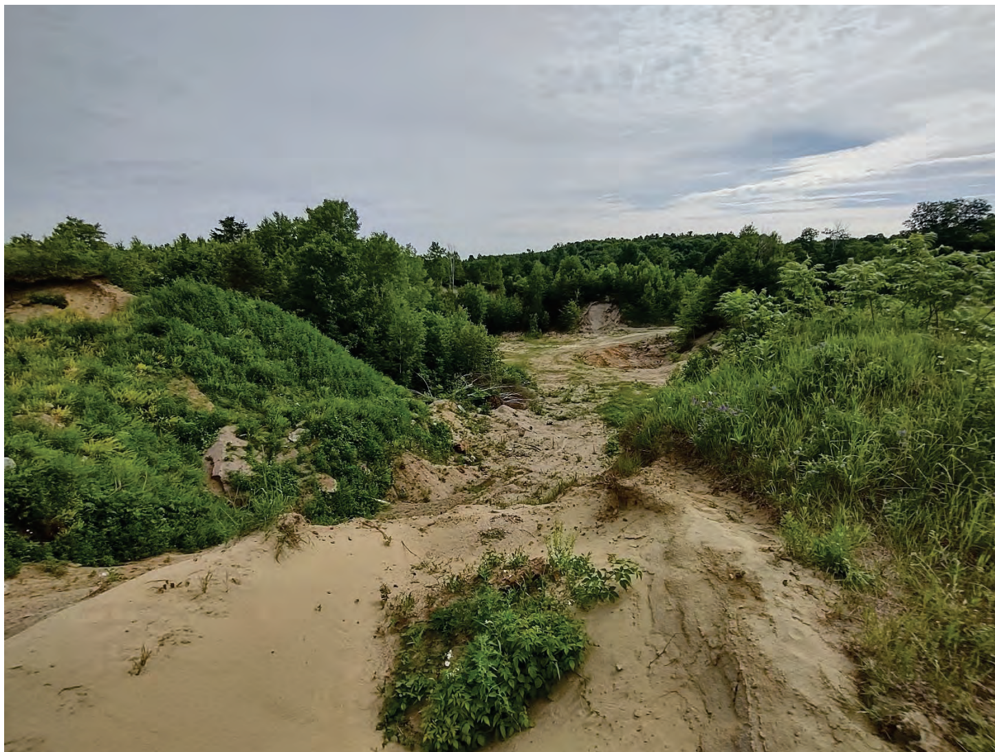
Photo 3. Secteur de l'ancienne sablière où la végétation reprend tranquillement place