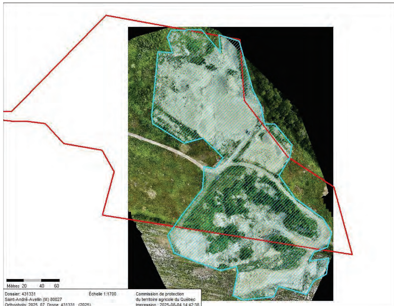
Figure 1. Plan d'ensemble localisant la décision 431331 en rouge et la superficie ouverte en bleu (3,5 ha)