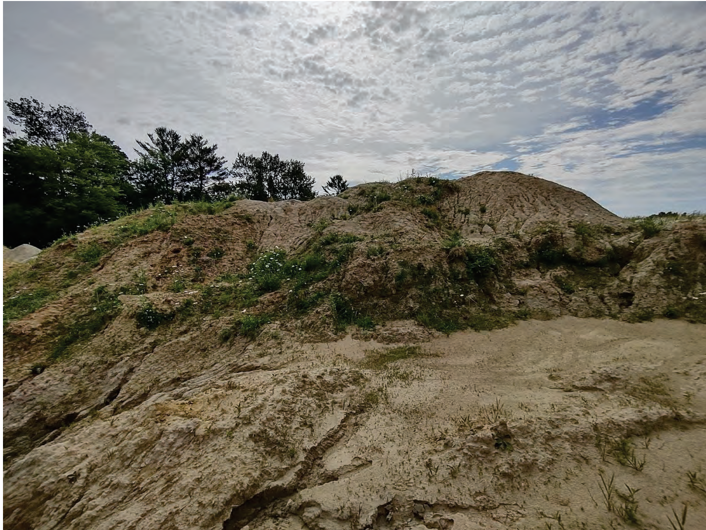
Photo 5. Amas de sol arable mélangé ou horizon B